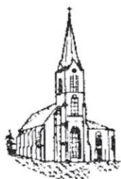
Spahnharrenstätte St. Johannes der Täufer