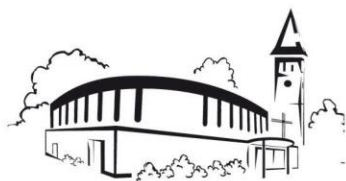
Werpeloh St. Franziskus